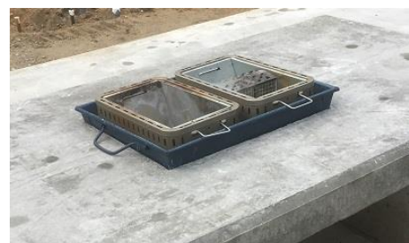
専用のグリル設置の様子