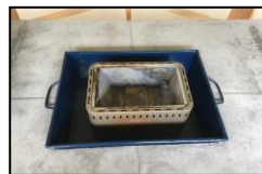
※グリル1台(3～4名)での使用例

※レンタル物品は返却の際に点検がございます。きれいに洗って返却下さい。 ※グリル2台(6～8名)での使用例