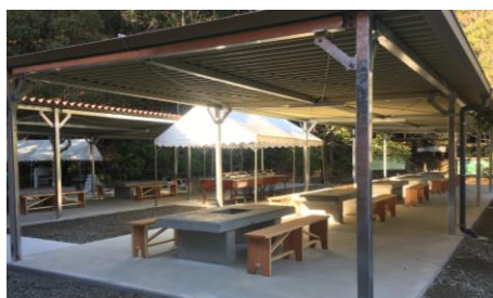
屋根付きのバーベキュー場