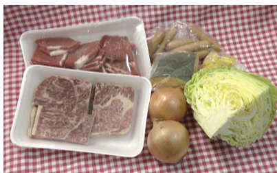
※写真はファミリーセット(4人分)です。

※4人分からご注文をお受けいたします。 ※バーベキューにご飯はついておりません。 ※バーベキューの野菜はカットしておりません。