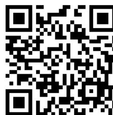
WEBフォーム用QRコード