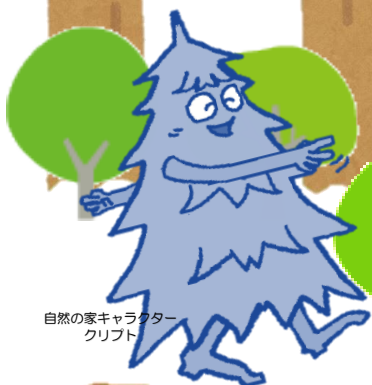
自然の家キャラクター 三エリア

自然の家のマスコットキャラクターたちが 森の中でかくれんぼしているよ。 親子で森を散歩しながらみんなを探してね！ 全員見つけることができるかな？