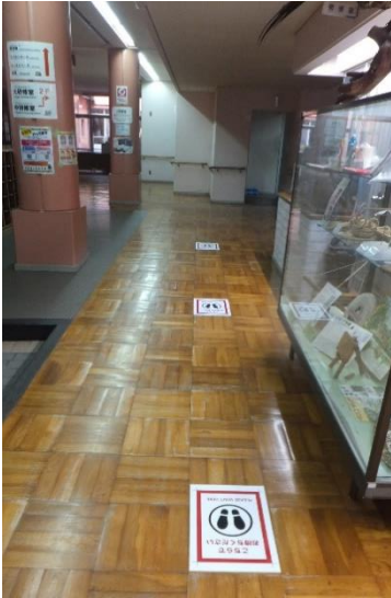
受付・ロビーまわり