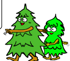
自然の家マスコットキャラクター クリプト ミエリア

普段の生活ではなかなか気づきにくいけど、 森林にはたくさんの役割があるんだよ。森の大切さについて遊びながら学んでほしいな♪