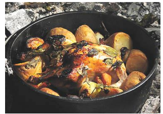
↑ 野外料理(ダッチオーブン)