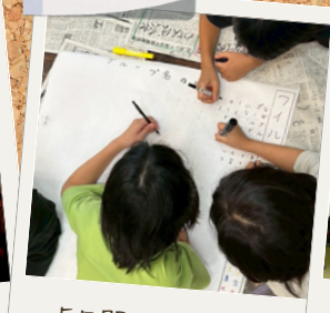
5日間のふりかえり