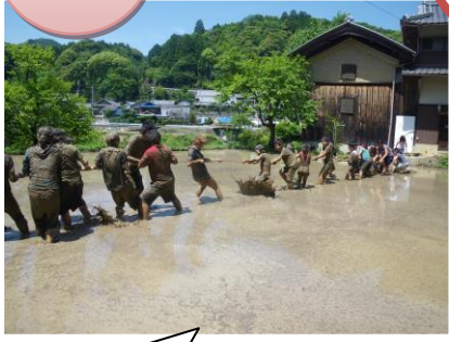
どろんこ綱引き大会